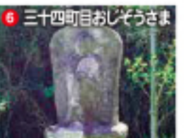
6 三十四町目おじぞうさま

「クレヨン王国森のクリスマス物語 まほう使いのおとしもの」まほう使いがすの山。 「クレヨン王国なみだ物語 人形のなみだ」子ザンネートもこの山がら雲の舟を熱海海上空にこぼしました。