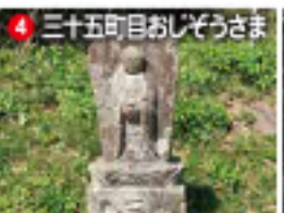
4 三十五町目おじぞうさま

アニメ「夢のクレヨン王国 9月の旅Ⅰ」のモチーフ。 両サイドからトンネル状に伸びた樹々の木漏れ日は異世界へいざないます。