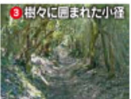
3 樹々に囲まれた小径

「クレヨン王国の花ウサギ」東光寺のモチーフ。 273年桓業上人が開山。春秋のお彼岸には麓の熱海市や蒲原郡司から多くの方が参拝に訪れます。熱海、蒲原郡から日金山四十二丁目まで一丁ことおじぞうさまがおり石仏ハイキングコースとしても親しまれています。