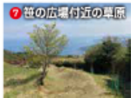
7 笹の広場付近の草原

「クレヨン王国の赤いぼうし」(クレヨン王国ロベとキャンベツの物語に登場)がんしゃくおじぞうのモデル。リスのリーとイタ子のチーが落ちてしまった悪い帽子をおじぞうさまが返して靴かしました。