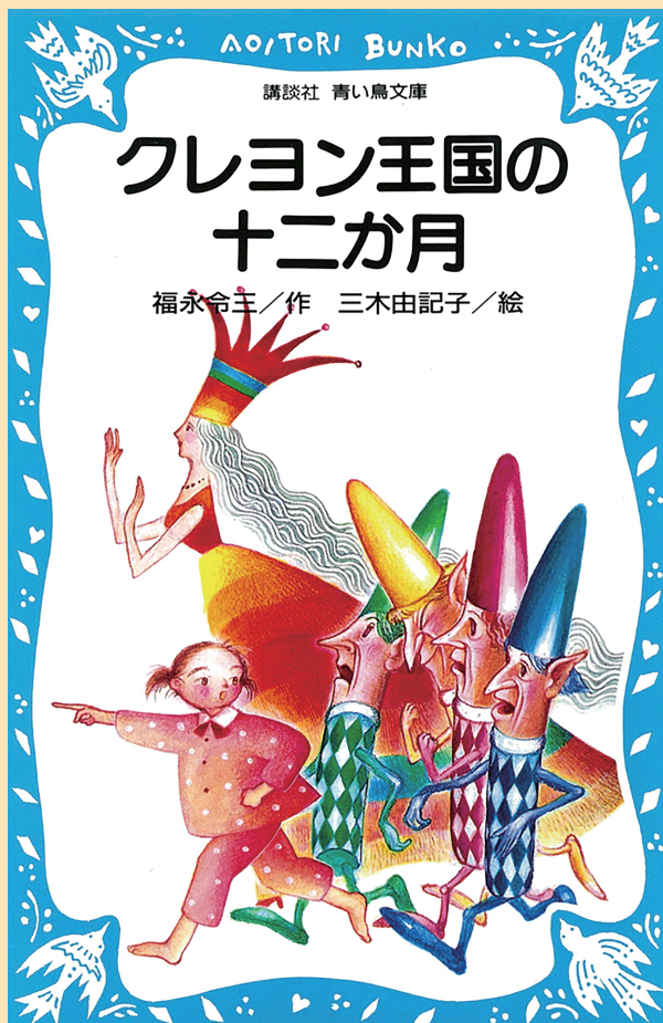
福永令三 / 作 三木由記子 / 絵「クレヨン王国の十二月」講談社青い鳥文庫

熱海で生まれたファンタジー童話クレヨン王国シリーズの 読書感想画を広く募集します！