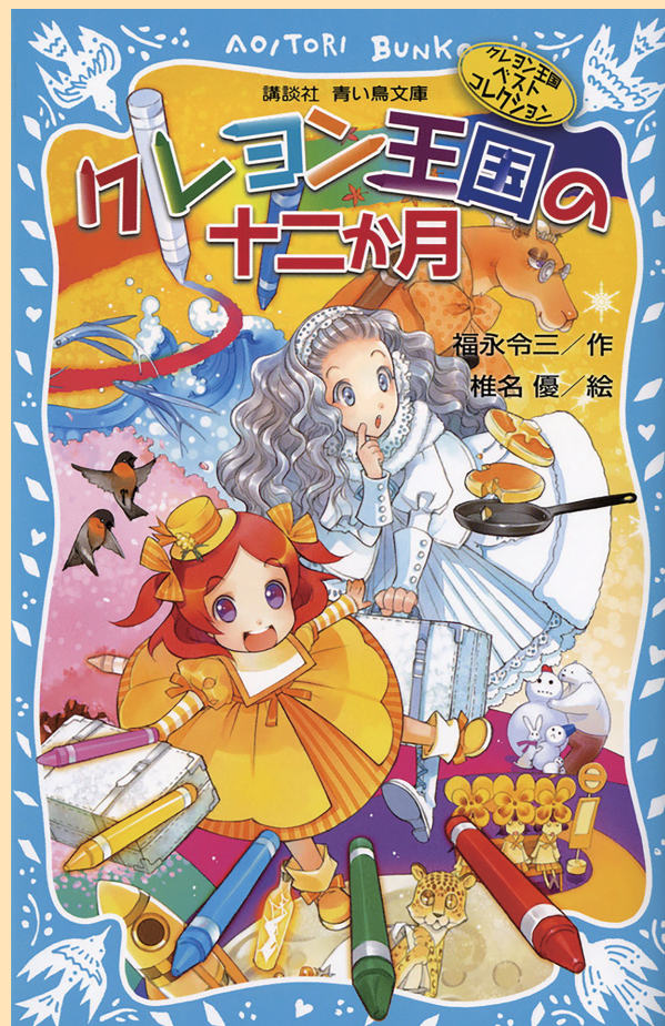
福永令三 / 作 椎名優 / 絵「クレヨン王国の十二月」講談社青い鳥文庫